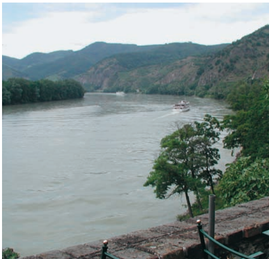
Εικόνα 15.3: Ο ποταμός Δούναβης

Μια άλλη χρήση του νερού των ποταμών έκανε και ο Ηρακλής σε έναν από τους άθλους του. Θυμηθείτε ποιος ήταν ο άθλος αυτός και βρείτε στο χάρτη σε ποιους ποταμούς της Πελοποννήσου άλλαξε τη ροή του νερού, για να το χρησιμοποιήσει.