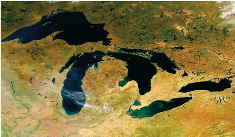
Εικόνα 14.3: Περιοχή μεγάλων λιμνών της Αμερικής