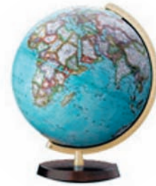
Εικόνα 13.3: Η υδρόγειος σφαίρα

Γίνε για λίγο ένας νέος Μαγγελάνος που ταξιδεύει με αεροπλάνο. Ξεκίνα από τον Πρώτο Μεσημβρινό (Γκρίνουιτς, Λονδίνο) με κατεύθυνση προς ανατολικά κατά μήκος ενός παράλληλου του βόρειου ημισφαιρίου. Ποιες οροσειρές και ποιες μεγάλες πεδιάδες θα συναντήσεις;