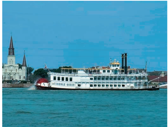
Εικόνα 15.4: Ο ποταμός Μισισιπής

Ο Δούναβης και ο Μισισιπής στο μεγαλύτερο μέρος τους είναι πλωτοί ποταμοί , δηλαδή επιτρέπουν τη συγκοινωνία με ποταμόπλοια. Οι παραποτάμιες πόλεις έχουν πολλά οφέλη από τους ποταμούς.