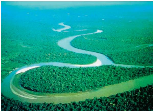
Εικόνα 14.1: Ο Αμαζόνιος ποταμός