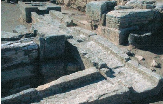
Εικόνα 15.2: Αποχέτευση στην Κνωσό

Το 3000 π.Χ. κατά τη μινωική περίοδο αναπτύχθηκαν όλες οι χρήσεις του νερού. Οι ανασκαφές στα ανάκτορα της Κνωσού αποκάλυψαν ένα τέλειο αποχετευτικό σύστημα, λουτρά και εγκαταστάσεις για γεωργική εκμετάλλευση του νερού. Αυτό σημαίνει ότι ο άνθρωπος από πολύ παλιά είχε συνδέσει τη ζωή του με το γλυκό νερό.