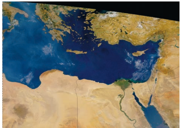
Εικόνα 14.2: Ο Νείλος ποταμός

Η εικόνα 14.1 παρουσιάζει τον Αμαζόνιο, το δεύτερο μεγαλύτερο σε μήκος ποταμό της Γης μετά τον Νείλο (εικόνα 14.2). Γύρω από τις όχθες του Αμαζονίου βρίσκεται το μεγαλύτερο δάσος της Γης. Εδώ παράγεται με τη διαδικασία της φωτοσύνθεσης το 35% του οξυγόνου της ατμόσφαιρας, γι' αυτό η περιοχή θεωρείται ο «πνεύμονας» του πλανήτη.