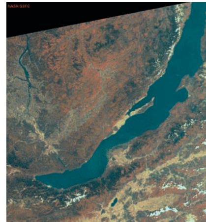
Εικόνα 14.4: Λίμνη Βαϊκάλη

Οι λίμνες της Γης καλύπτουν λιγότερο από το 2% της επιφάνειάς της. Οι περισσότερες περιέχουν γλυκό νερό. Μερικές είναι αλμυρές, όπως η Κασπία και η Νεκρή Θάλασσα, της οποίας μάλιστα το νερό είναι 7,7 φορές πιο αλμυρό από το θαλασσινό.