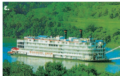
Εικόνα 15.1: Το νερό στη ζωή