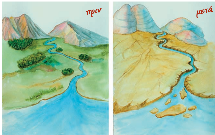
Εικόνα 16.4: Αποτελέσματα διάβρωσης