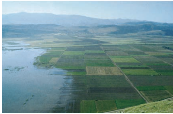
Εικόνα 15.5: Φυτοφάρμακα και λιπάσματα στη λίμνη